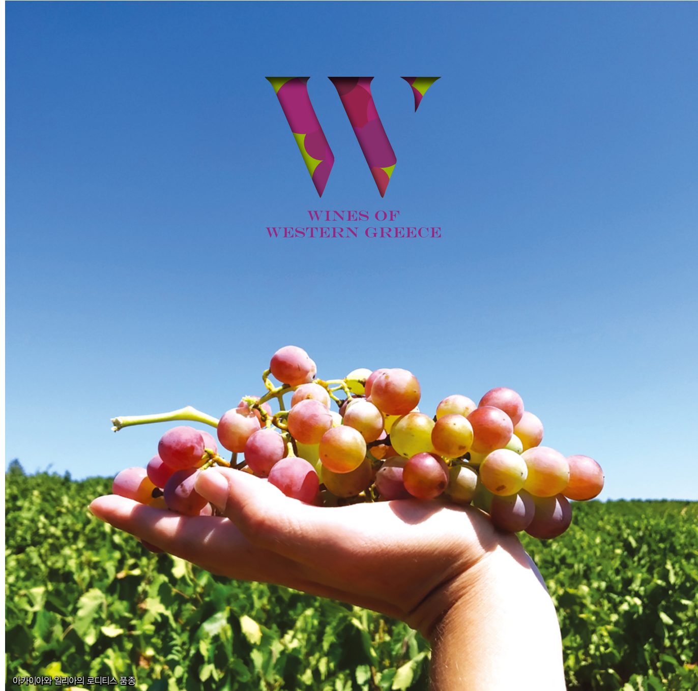
아카이아와 일리아의 로디티스 품종